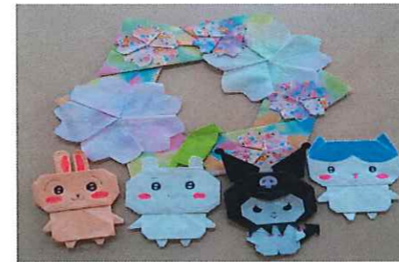
春～かわいいですね♪

折り紙で上手に可愛く飾り物を作ってくれました。 いつもありがとうございます(#^.^#)